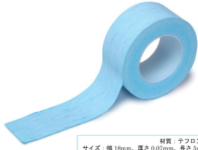
材質：テフロン サイズ：幅 18mm、厚さ 0.07mm、長さ 3m カラー：ライトブルー