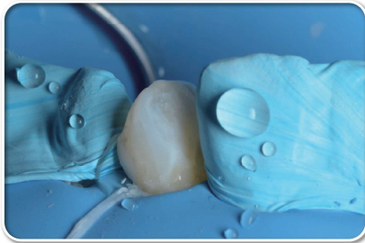
撥水性に優れた歯科用テフロンテープです。