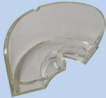
材質：ポリアミド樹脂 サイズ：横 66mm × 縦 36mm × 高さ 29mm